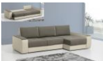
Ref. Nº CHAISElucho