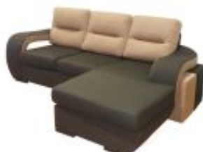
Ref. Nº CHAISEcometa Chaiselong modelo Cometa