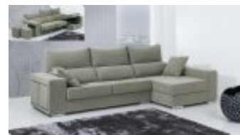
Ref. Nº CHAISEluna