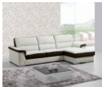
Ref. Nº CHAISEmonika