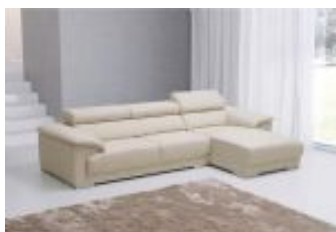
Ref. Nº CHAISEmathew