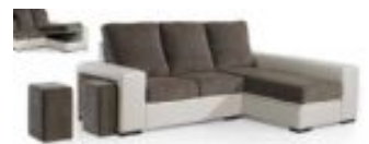
Ref. Nº CHAISEparma