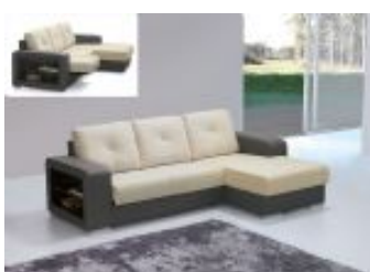
Ref. Nº CHAISerafa