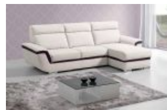
Ref. Nº CHAISEemma Chaiselong modelo Emma