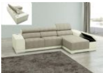
Ref. Nº CHAISEvicent Chaiselong modelo Vicent