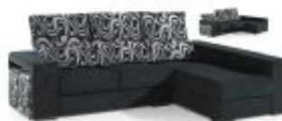
Ref. Nº CHAISEgenova Chaiselong modelo Génova