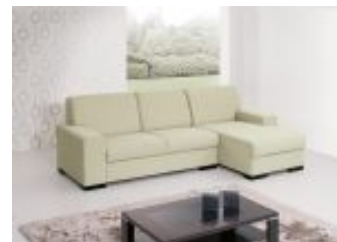
Ref. Nº CHAISEboss Chaiselong modelo Boss