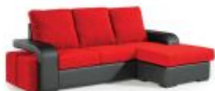
Ref. Nº CHAISERimini Chaiselong modelo Rimini reversível