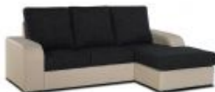
Ref. Nº CHAISEandria Chaiselong modelo Andria reversível