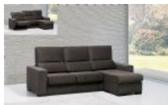
Ref. Nº CHAISeraquel