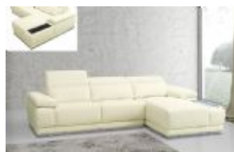
Ref. Nº CHAISEvince Chaiselong modelo Vince