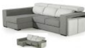
Ref. Nº CHAISEbari Chaiselong modelo Bari