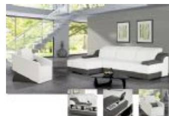
Ref. Nº CHAISEwave Chaiselong modelo Wave