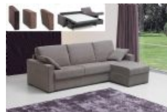
Ref. Nº CHAISEuno Chaiselong modelo Uno