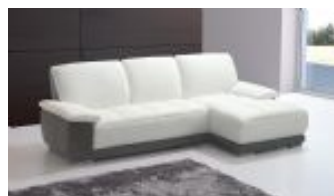
Ref. Nº CHAISEtommy Chaiselong modelo Tommy