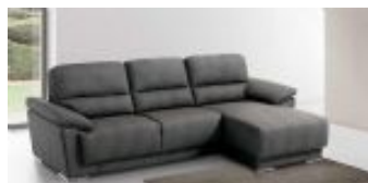
Ref. Nº CHAISEzarco Chaiselong modelo Zarco