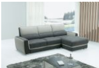
Ref. Nº CHAISEmedina