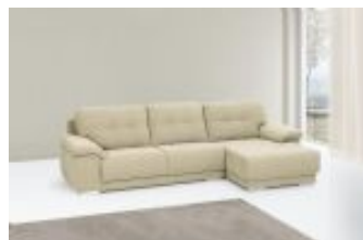
Ref. Nº CHAISEluke