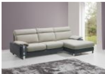
Ref. Nº CHAISEalanya Chaiselong modelo Alanya