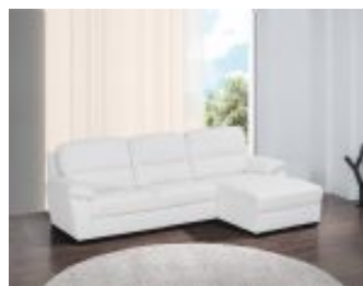
Ref. Nº CHAISEdado Chaiselong modelo Dado