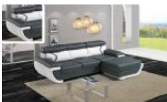
Ref. Nº CHAISEsmile Chaiselong modelo Smile