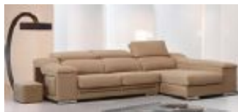
Ref. Nº CHAISEfunky Chaiselong modelo Funky