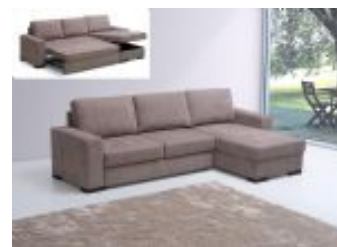
Ref. Nº CHAISERiga