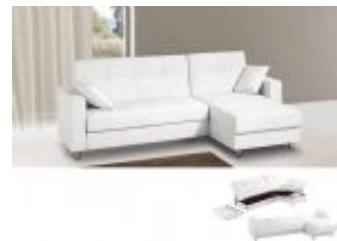
Ref. Nº CHAISEkelly Chaiselong modelo Kelly