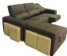
Ref. Nº CHAISEtroia Chaiselong Tróia