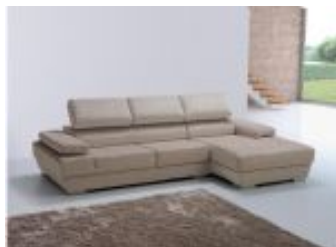
Ref. Nº CHAISEprestige