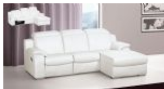
Ref. Nº CHAISEvega Chaiselong modelo Vega