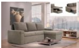
Ref. Nº CHAISEcombi Chaiselong modelo Combi